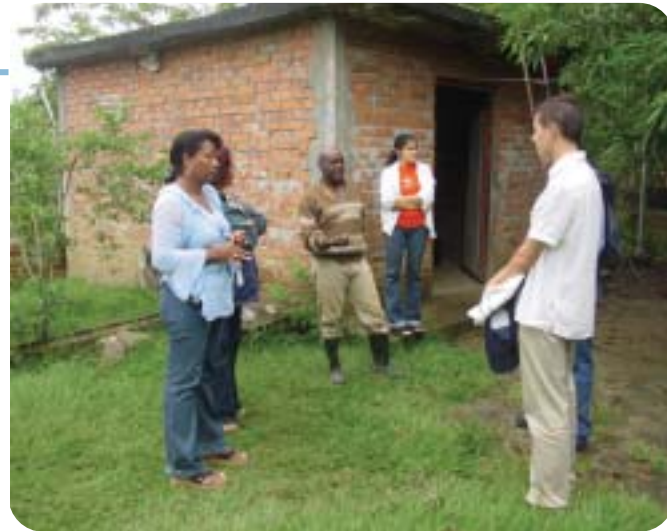
Personal del IRC y CINARA con los miembros de la comunidad de El Hormiguero, Colombia.