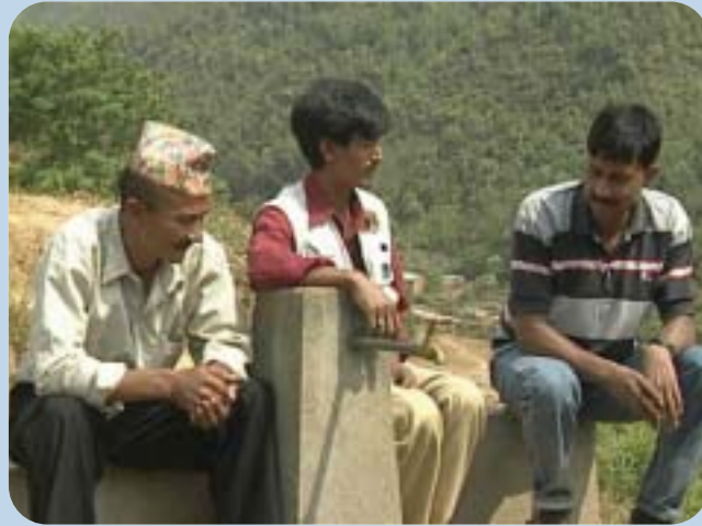
Un miembro de NEWAH discute con un comité de agua comunitario en Nepal.